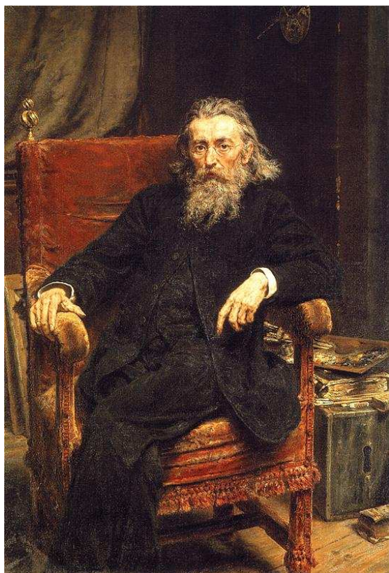
Jan Matejko (1838-1893)

Autoportret, 1892, olej, płótno, 160 x 110 cm. Muzeum Narodowe w Warszawie